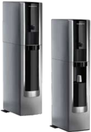
aqueduct FLEXi STORE +